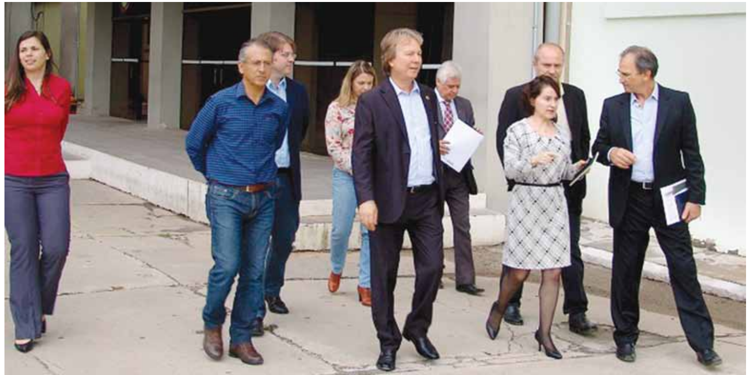
Comitiva visitou campi e unidades da UFPel