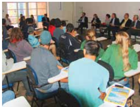
Grupo recebeu em abril a visita de comitiva do MEC

“No início, foram muitas as dificuldades de interação, mas agora