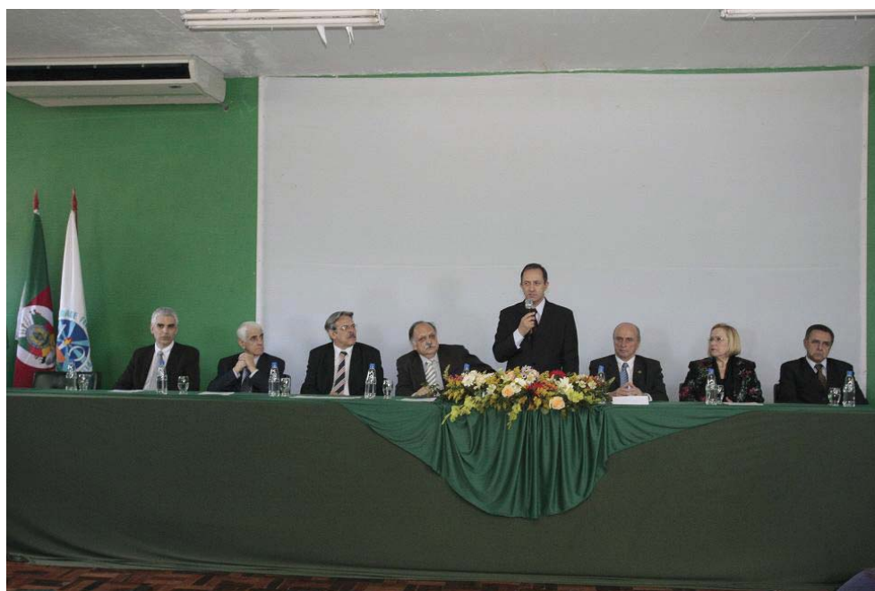
Reitor coordenou ato de lançamento do edital do HE