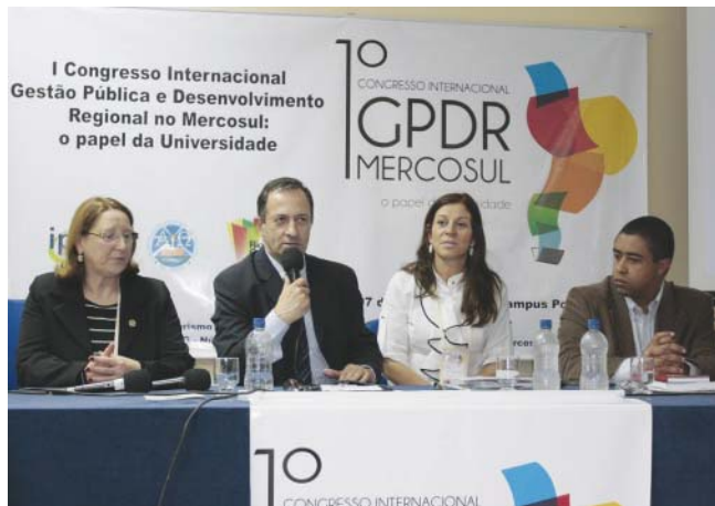
Universidade tem vasta atuação na fronteira

Aumentando ainda mais sua atuação na faixa de fronteira, especialmente a com o Uruguai, a UFPel prepara uma série de novos projetos em diversas áreas, como do transporte, da cultura, da saúde e da educação. Os projetos são os relativos à Hidrovia do Mercosul, à instalação do Polo Multicultural Mercosul União Europeia, às Unidades Binacionais Fronteiriças de Saúde e à Escola Binacional de Conservação e Restauro.