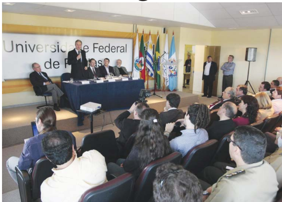
Conde: "Mercosul é a base da integração continental"

Antes de encerrar, Conde garantiu o apoio do Uruguai, no Focem, que é o Fundo para Convergência Estrutural do Mercosul, para a