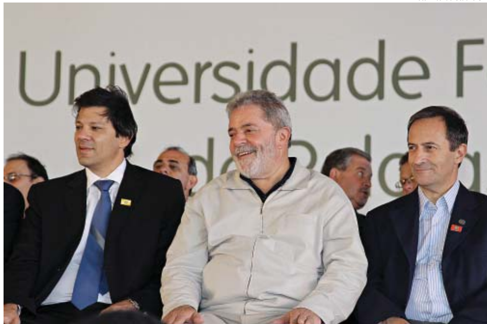
Lula cativou o público com seu discurso e disponibilidade para atender a todos

Mas o momento maior do presidente na cerimônia ficaria reservado para o fim de sua passagem pelo campus da UFPel. Por mais de 30 minutos, cumprimentou populares, tirou fotos, distribuiu autógrafos e abraços e trocou rápidas palavras com quem desejasse falar com ele, tudo junto à grade que separava o público do palanque oficial.