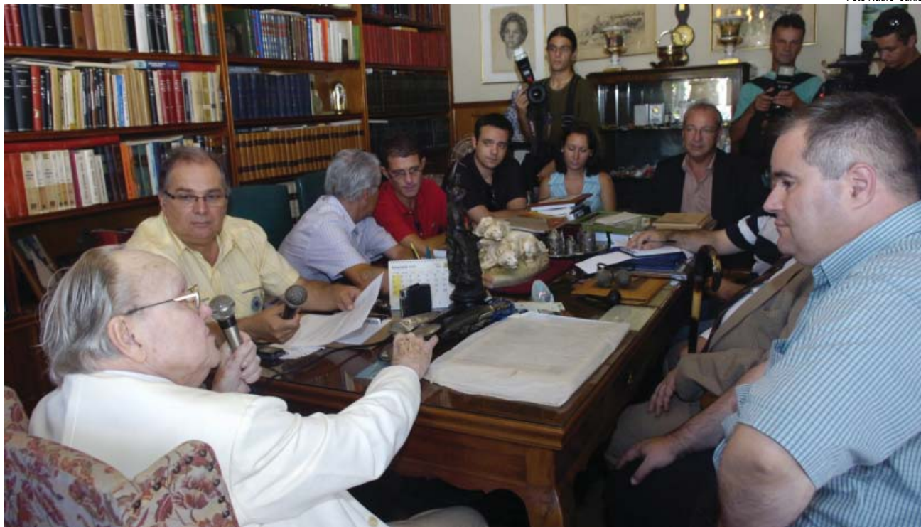
Programa Pelotas 13 Horas, transmitido direto da residência de Russomano