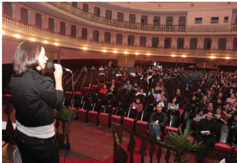
Tema foi amplamente discutido por especialistas