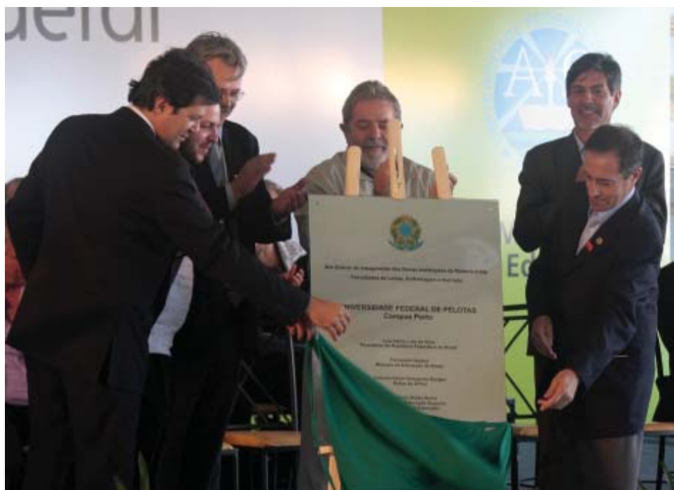
Descerramento da placa oficial de inauguração