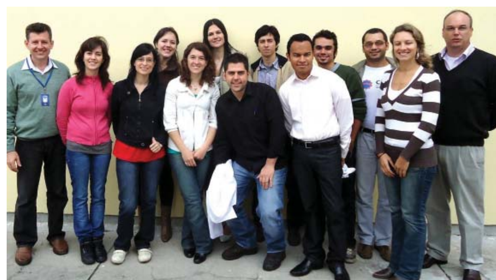
Pesquisadores de diversas instituições reuniram-se na UFPel

Os estudantes que realizaram o curso são alunos de mestrado ou doutorado, de diferentes instituições, que estão buscando formação específica na área do curso para