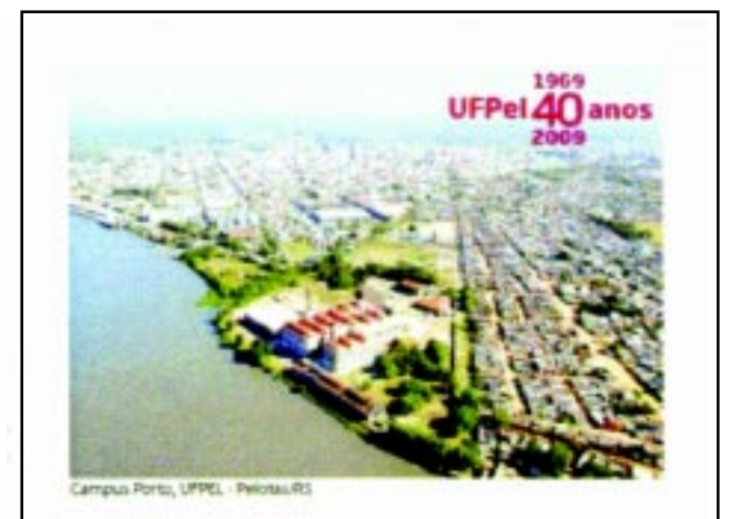
Campus Porto, UFPel - Pelotas/RS