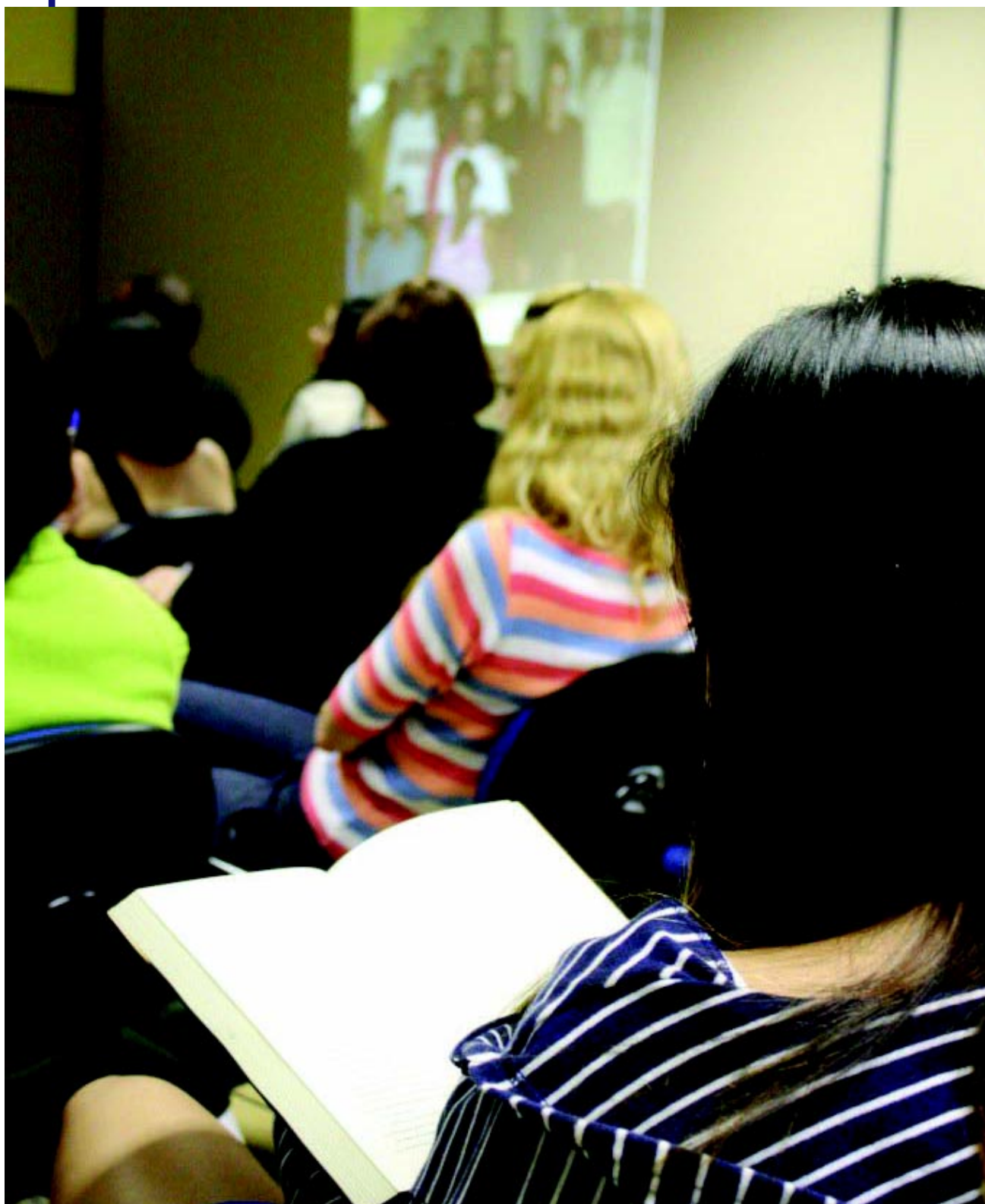
Número de alunos e de cursos cresce significativamente com o Reuni

Na área de Biotecnologia há diversos projetos de grande porte sendo desenvolvidos. Através de parceria com pesquisadores do Centro de Biotecnologia, da Engenharia de Materiais e da Odontologia, está sendo realizado um projeto na área de Nanobiotecnologia que poderá resultar em novos produtos para a área