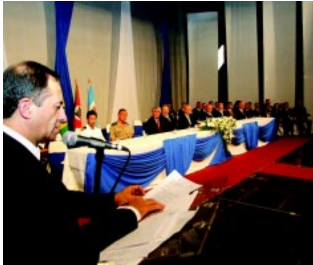
da Unipampa, desafio que considera vencido e plenamente recompensado.

Em seu pronunciamento, o reitor destacou o papel decisivo das fundações de apoio (FAU, Simon Bolívar e Delfim Mendes Silveira), na aquisição de equipamentos, na realização de obras e no suprimento de recursos humanos, que estão permitindo o processo de expansão da Universidade. Ele enalteceu também o trabalho da UFPel na implantação e consolidação