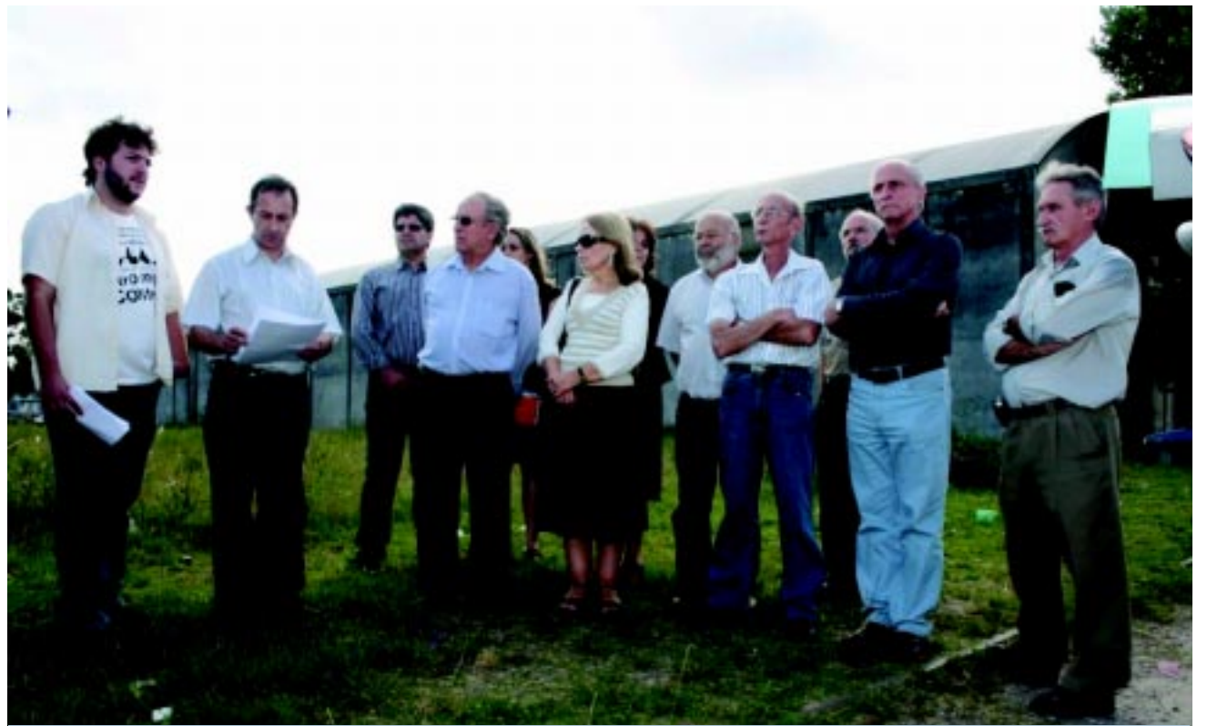
Anúncio foi feito no terreno comprado

O novo imóvel da UFPel representa um investimento de R$ 2 milhões, obtidos junto ao Ministério da Educação, através do Reuni. "O recurso foi disponibilizado para que empregássemos da forma como nos parecesse melhor. E escolhemos gastá-lo em benefício da comunidade estudantil", observou o reitor, que na oportunidade recebeu um ofício do Diretório Central dos Estudantes(DCE), solicitando a construção de um centro de