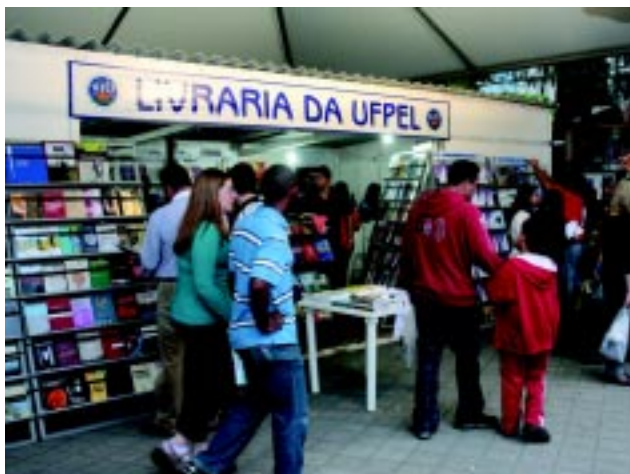
Foram 121 livros lançados na Feira

A Editora e Gráfica Universitária da UFPel estabeleceu na 37ª Feira do Livro de Pelotas um recorde nacional entre as editoras universitárias do País, lançando 121 títulos nas diversas