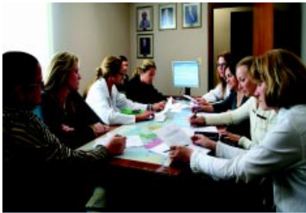
Coordenação do Curso debate projeto

A residência multiprofissional é uma reivindicação antiga dos profissionais de saúde. O novo conceito, que está sendo implantado em vários cursos da área de saúde e unidades de tratamento, humaniza o atendimento. Além do profissional, que estará habilitado a enxergar o paciente na sua totalidade e não