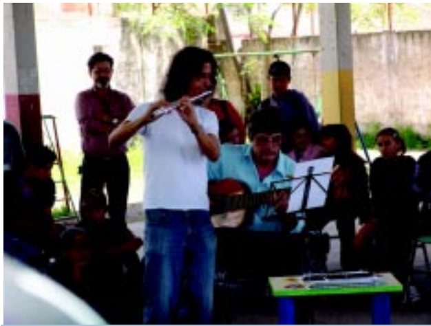
A arte é um dos focos do programa